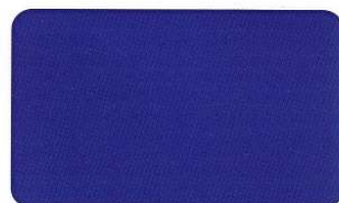
Blau 2738 C 100/79/0/0