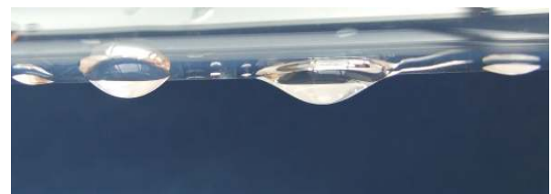
Quarzglas-Hüllrohr ohne T-Tauri Beschichtung