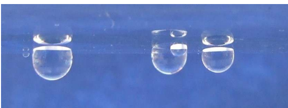
Quarzglas-Hüllrohr mit T-Tauri Beschichtung