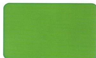
Grün 354 C 91/0/83/0