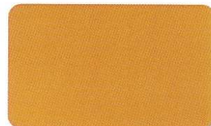
Gelb 1375 C 0/38/76/0