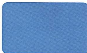
Blau 2925 C 87/23/0/0