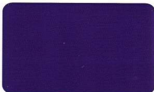
Violet 268 C 94/91/0/0

Weiß können wir nur als deckenden Farbton herstellen. Alle vorstehend abgebildeten Farben können auch in seidenmatt produziert werden. Wir weisen darauf hin, dass die abgebildeten Farben nur Richtwerte darstellen. Auf einem transparenten Hintergrund, wie Glas, kann die Farbwirkung von der Farbabbildung abweichen.