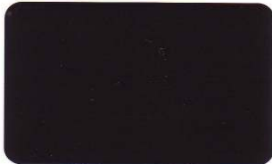
Schwarz 3 C 69/0/43/100