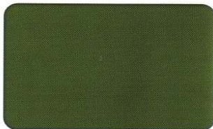
Grün 357 C 79/0/87/56