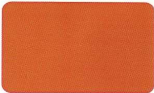
Orange 172 C 0/69/83/10