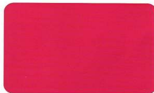
Rot 206 C 0/100/43/0