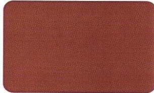
Braun 499 C 0/56/60/47